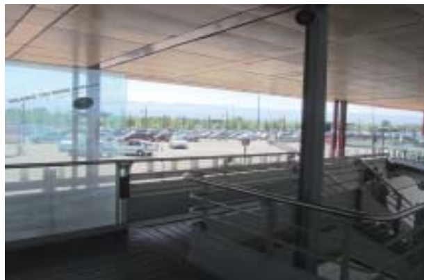
La gare TGV de Valence présente les mêmes caractéristiques que la future gare TGV Belfort-Montbéliard / Franche-Comté.

A l'initiative de la SNCF, les 4 cercles territoriaux du club TGV Rhin-Rhône ont visité, le 8 juillet, la gare TGV de Valence, qui présente les mêmes caractéristiques que la future gare TGV Belfort-Montbéliard / Franche-Comté. Ce déplacement a été l'occasion, en échangeant avec plusieurs interlocuteurs économiques locaux, de mesurer les avantages et inconvénients d'une telle gare.