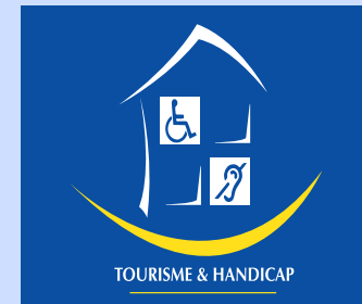
Présentation du label avec 2 handicaps